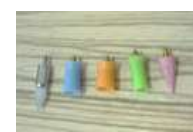
クリーニング用ブラシ

皆様が院内で座っているユニットもアルコールでしっかり拭き、中からもしっかり消毒をしています。他にもご紹介しきれない物がたくさんあります。どうぞご安心してご来院下さい。ご質問等あればお声かけください☆