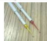
薬剤塗布用チップ